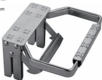
K2-2 クライマー 左右 180mm 奥行 150mm