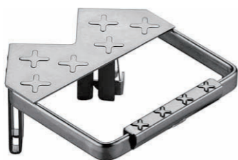
K2-3 コーナークライマー サイズ/タテ 180mm ヨコ 180mm