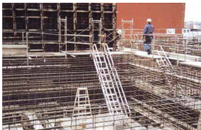
ケーソン階段設置